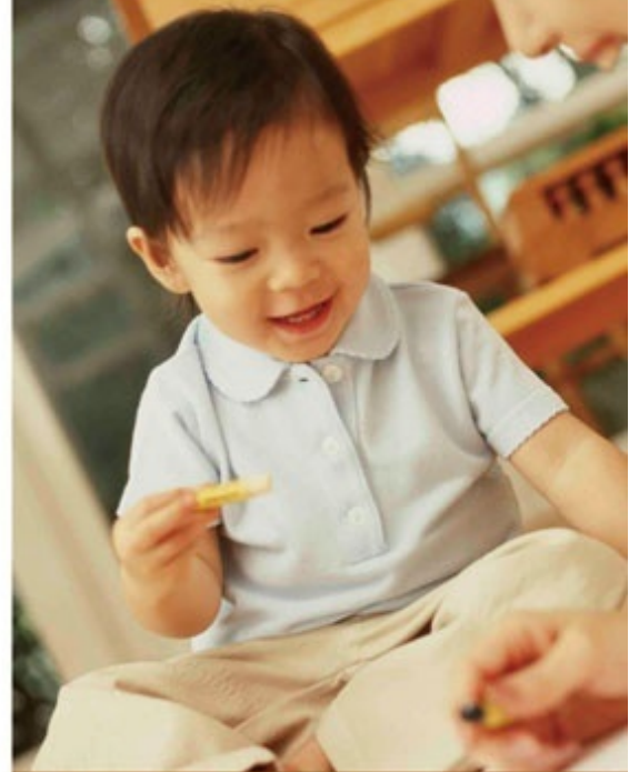
What do you tell to a child?